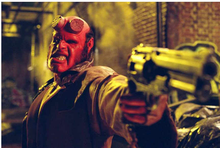
Hellboy (Ron Perlman)