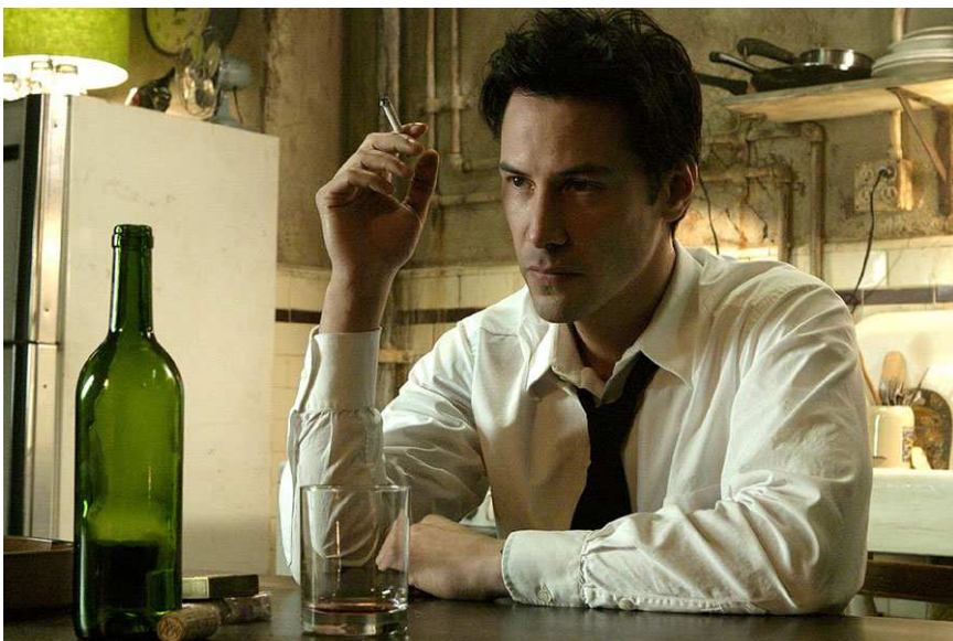
John Constantine (Keanu Reeves)