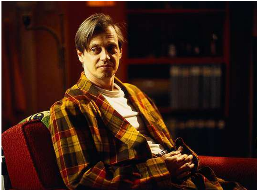
Saymour (Steve Buscemi)