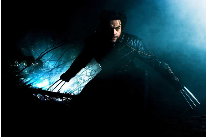
Wolverine (Hugh Jackman)